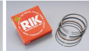
高い精度と信頼のRIKEN製ピストンリング