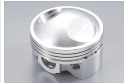
専用ハイコンプ鍛造削り出しピストン

(キット内容) HRシリンダーヘッドASSY(ハイレンジバルブスプリング組込済)、ハイレンジカムシャフト φ52mm鍛造削り出しピストン・ピストンリング・アルミシリンダー(鑄鉄スリーブ)・ 13x36ピン・クリップ・スチールヘッドガスケットセット