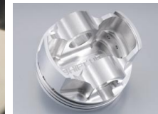
鍛造削り出しピストン

(キット内容) φ52mm鍛造削り出しピストン・RIKEN製ピストンリング アルミシリンダー(鑄鉄スリーブ)・13x36ピン・クリップ スチールヘッドガスケットセット