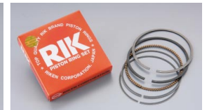
高い精度と信頼のRIKEN製ピストンリング